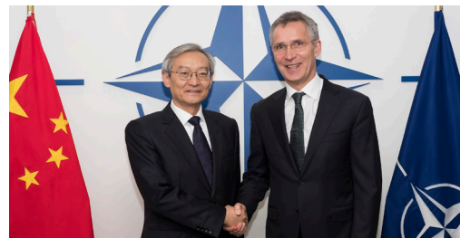
Generální tajemník NATO Jens Stoltenberg a velvyslanec Číny při EU Zhang Ming (2018).

Na základě svého stěžejního úkolu, tj. zajišťování bezpečnosti členských zemí, se Severoatlantická aliance začíná věnovat i otázce, zda ekonomický a vojenský rozmach Číny poslední doby může plnění tohoto úkolu ovlivnit. Na schůzce nejvyšších představitelů aliančních zemí v Londýně v prosinci 2019 se spojenci shodli na tom, že rostoucí vliv Číny na mezinárodní scéně představuje pro NATO „příležitost i výzvu“. Stalo se historicky vůbec poprvé, kdy je Čína v deklaraci z aliančního summitu zmíněna. Hlavní impulz vzešel od USA, které ze své pozice hlavního garanta obranyschopnosti NATO vnímají nástup Číny coby možného globálního soupeře nejpálčivěji a označují ji za rostoucí hrozbu pro mezinárodní řád.