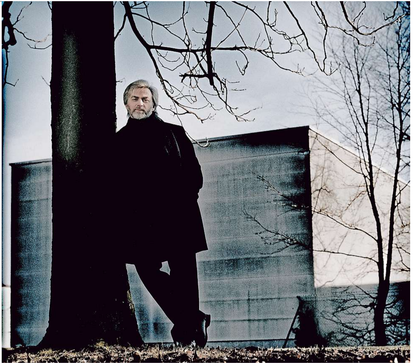
Všestranný génius Polského pianistu Krystiana Zimmermana proslavila nejvíce interpretace autorů 19. století, nicméně jeho záběr je mnohem širší. Dokáže to i svým festivalovým vystoupením.

Zimmerman se s Bernsteinem znal, koncertovali spolu, jejich kreace jsou zachyceny na zvukových a obrazových nosičích. Na DVD je k dispozici i společné provedení Věku