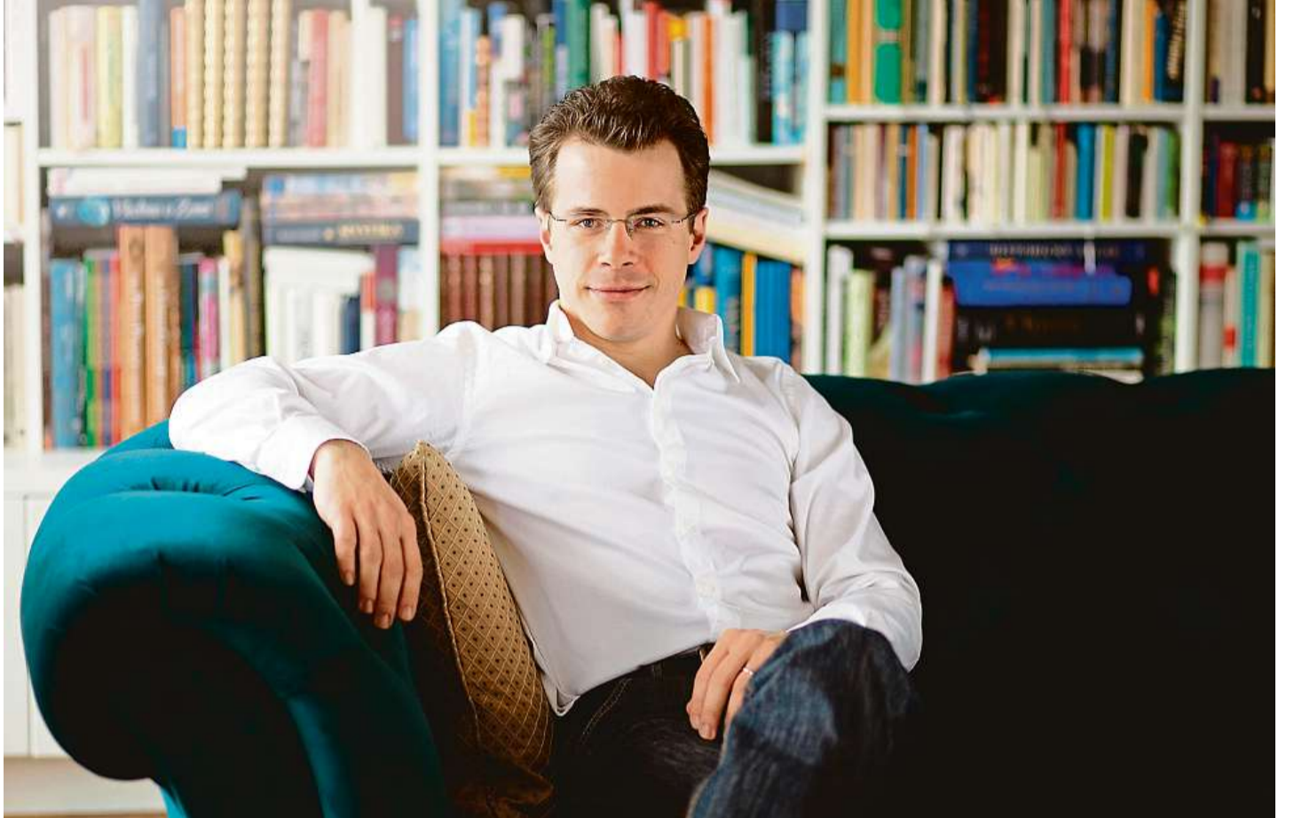
Úspěšný dirigent Jakub Hruša vede orchestry v Bamberku a v Londýně a je i v užším uměleckém vedení České filharmonie.

Do provedení Svatěbní košile Svatou Ludmilu naše publikum relativně dlouho neslyšelo. Nynější provedení je ohlášeno jako „původní kompletní verze“. Co si pod ní máme představit? Po prvním provedení pod Dvořákovou taktovkou v Anglii se Svatá Ludmila prakticky vždy uváděla se škrty. Naznačil je ostatně do partitury sám skladatel. Dílo bylo inspirováno tradicí monstrózních händelovských projektů na britských ostrovech a je známo, že Dvořák komentoval obří rozměry těchto událostí se smísením ohromené úcty a zděšeného úžasu - co je možné. Rozhodl se ovšem vyhovět této výzvě a vytvořil obří partituru. Moje rozhodnutí provést tentokrát