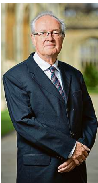
Dirigent Stephen Cleobury.

„Poprvé jsem ji slyšel, když ji natančil Choir of Christ Church Cathedral v Oxfordu, kde na varhany