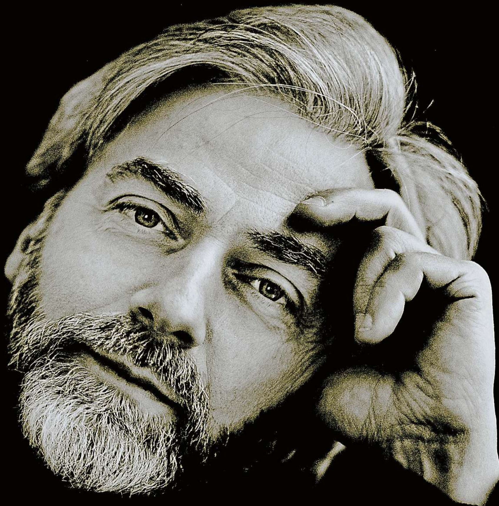
Klavírista Krystian Zimerman.